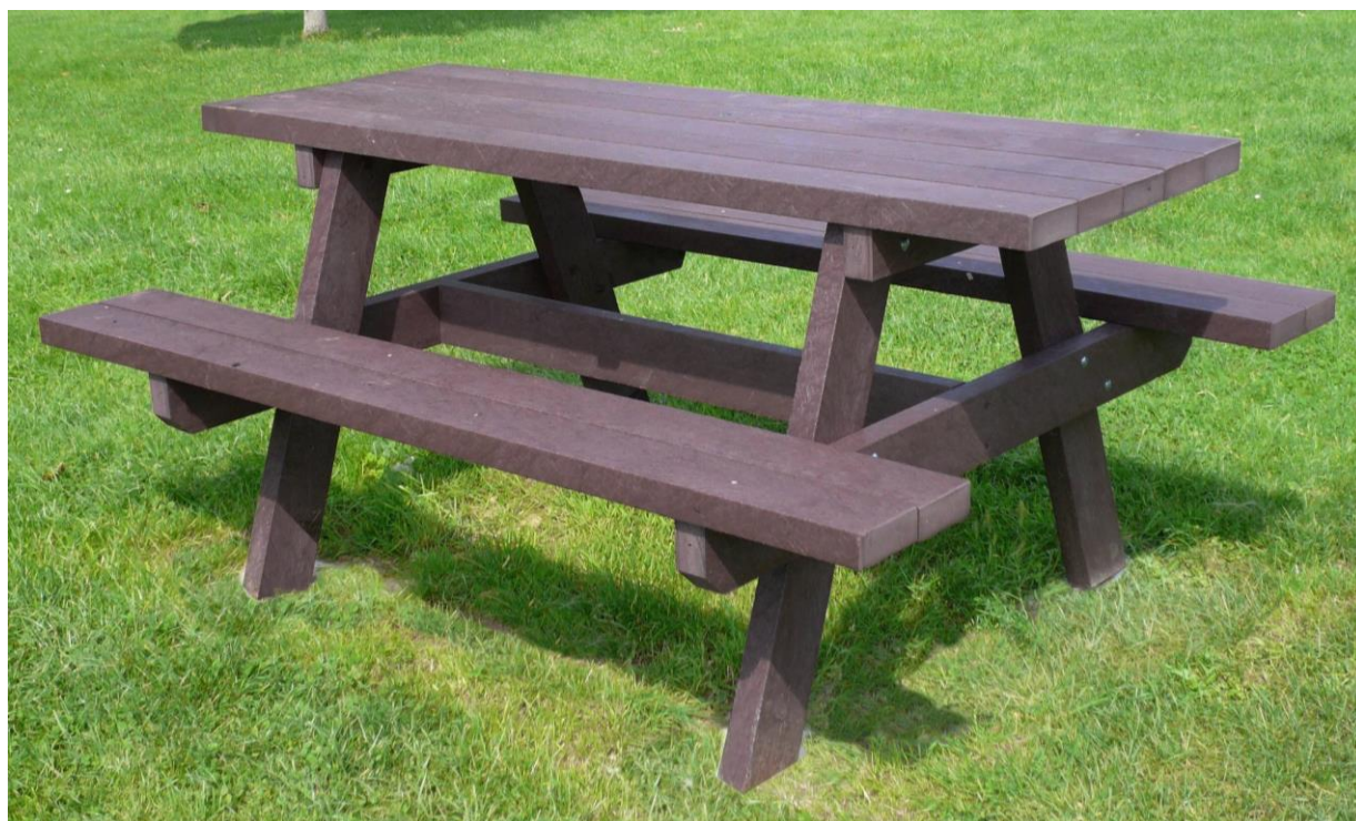
Table de pique-nique PARC prémontée