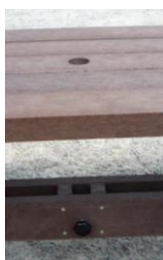
Trou parasol avec molette de maintien en option