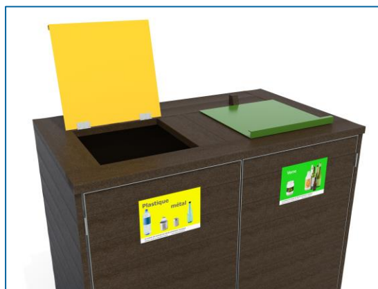
En option : trappes de couleur, plaque signalétique personnalisée