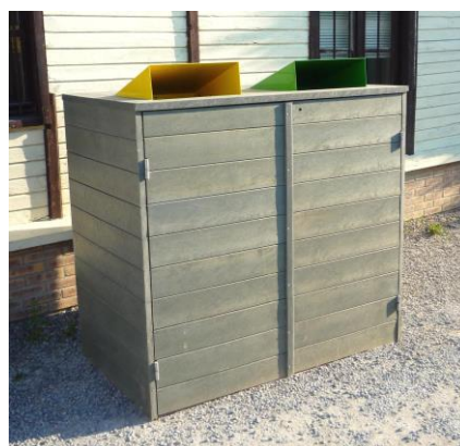
En option : casquettes