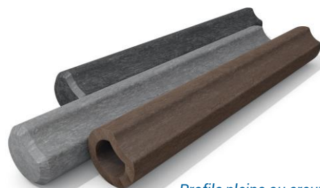
Profils pleins ou creux

✓ Résiste à l'humidité ✓ Anti mousses ✓ Anti-UV ✓ 100% durable