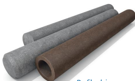
Profils pleins ou creux