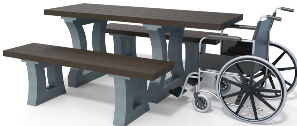
Table ARIZONA ECO180 PMR ref. 23.1ECO180.PMR + 2 banquettes PARC ECO ref. 01.2ECO150